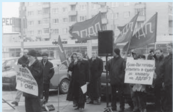
Ознакомиться с мероприятиями, проводимыми МГО ЛДПР, а так же получить справку по вступлению в ряды ЛДПР, можно по телефону 928-12-35.