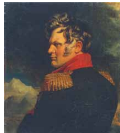
Но се — Восток подымлет вой!.. Поникни снежною главой, Смирись, Кавказ: идёт Ермолов! Пушкин, «Кавказский пленник», 1821

Сам побеждённый Шамиль, будучи пленённым и с честью доставленным в Москву, на вопрос, что он желает здесь видеть, ответил: «Прежде всего — Ермолова». Они встретились и имели долгую беседу. «Великодушные, бескорыстная храбрость и правосудие — вот три орудия, которыми можно покорить весь Кавказ, — писал