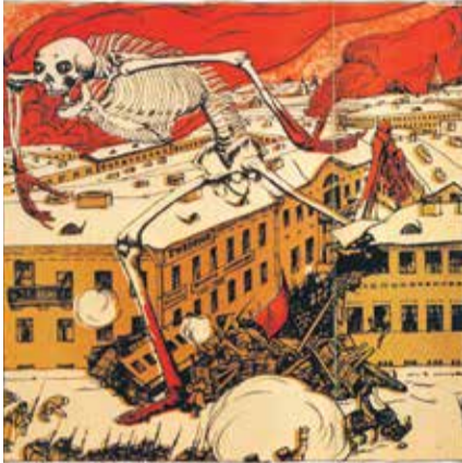
Худ.: Борис Кустодиев. «Революция 1905 года»

Несмотря на сдачу Порт-Артура и Цусимскую катастрофу, Русская армия вполне могла разгромить японцев. Наша сухопутная группировка в Маньчжурии была хорошо вооружена. Её бойцы с каждым днём получали всё больше подкреплений и оружия. В то же время японский экспедиционный корпус в Китае был лишён боеприпасов и обременён ранеными и больными. Русские должны были победить в Русско-японской войне к началу 1906 года. Но этого не случилось.