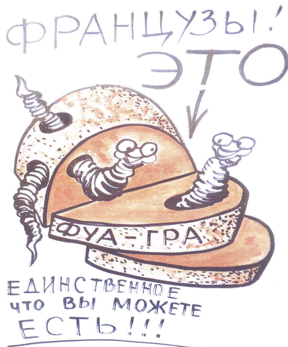
Французский деликатес — Фуа-гра с червями!