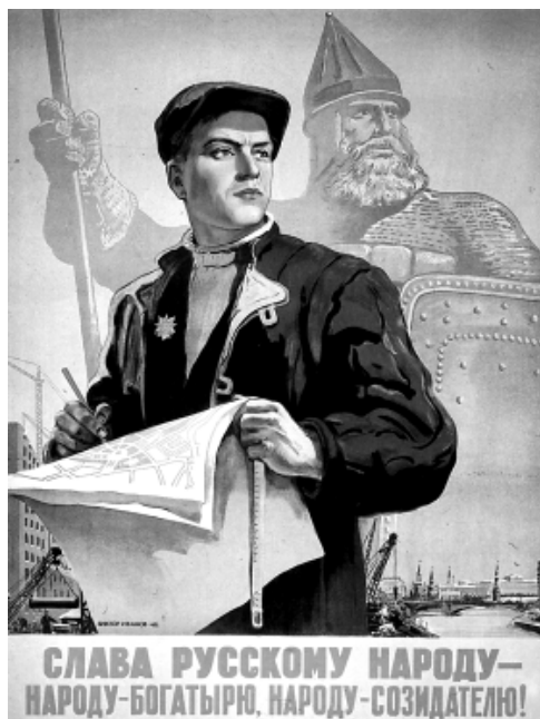
СЛАВА РУССКОМУ НАРОДУ - НАРОДУ-БОГАТЫРЮ, НАРОДУ-СОЗИДАТЕЛЮ!

ИЗДАНИЕ ЛИБЕРАЛЬНО-ДЕМОКРАТИЧЕСКОЙ ПАРТИИ РОССИИ И ФРАКЦИИ ЛДПР В ГОСУДАРСТВЕННОЙ ДУМЕ