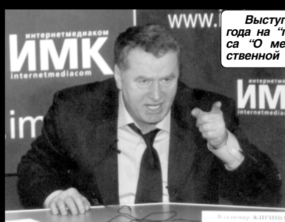
Выступление Жириновского в Госдуме 17 апреля 2002 года на "правительственном часе" при обсуждении вопроса "О мерах, принимаемых по обеспечению продовольственной безопасности и охране биоресурсов России".

Но время уходит, экономика России пробоксовывает на месте и нельзя терпеть такое положение вещей.