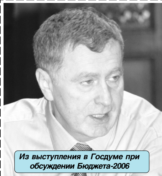
Из выступления в Госдуме при обсуждении Бюджета-2006

ИЗДАНИЕ ЛИБЕРАЛЬНО-ДЕМОКРАТИЧЕСКОЙ ПАРТИИ РОССИИ И ФРАКЦИИ ЛДПР В ГОСУДАРСТВЕННОЙ ДУМЕ