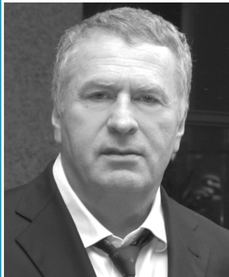
(Из выступления на «правительственном часе» в Госдуме)

Есть ошибки у Правительства, вот на эти ошибки и нужно указывать.