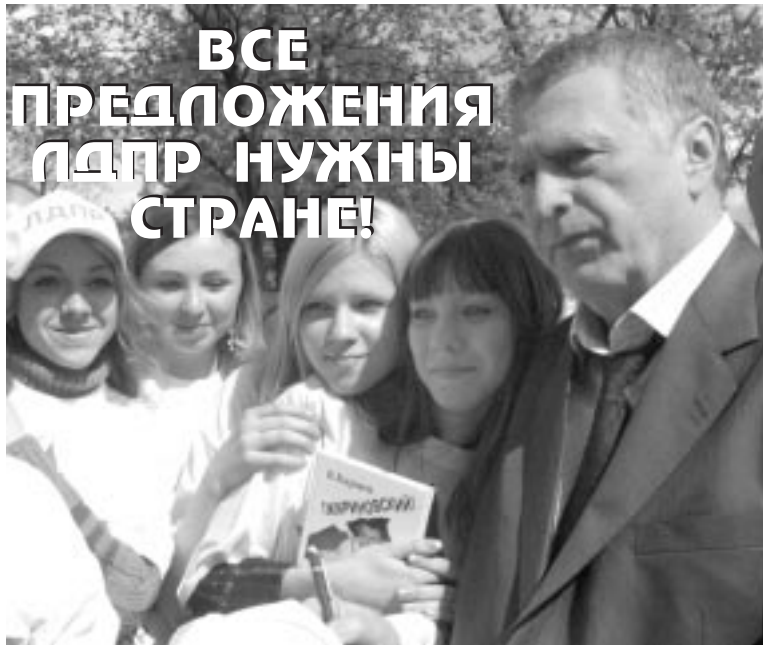
Владимир Жириновский отвечает на вопросы журнала «Власть»

ИЗДАНИЕ ЛИБЕРАЛЬНО-ДЕМОКРАТИЧЕСКОЙ ПАРТИИ РОССИИ И ФРАКЦИИ ЛДПР В ГОСУДАРСТВЕННОЙ ДУМЕ