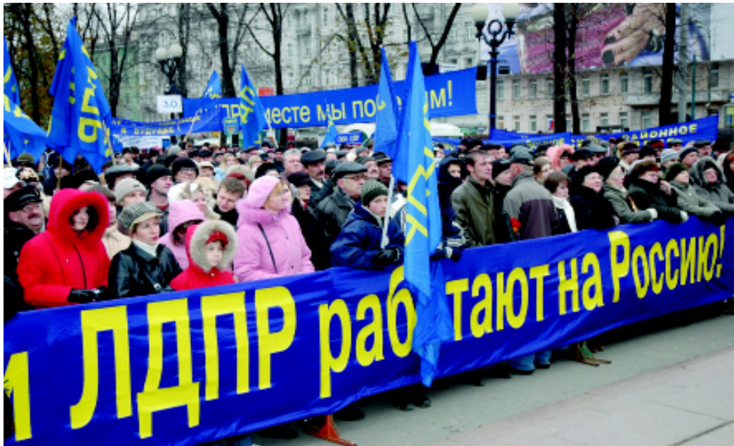
ИЗ ИСТОРИИ ЛДПР