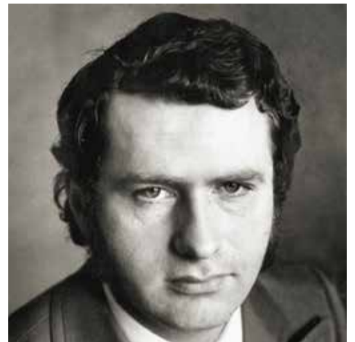
40 лет. 1986 год