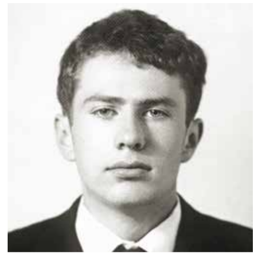
20 лет. 1966 год