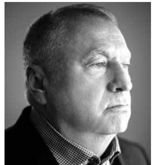
70 лет. 2016 год