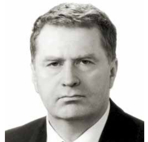
50 лет. 1996 год